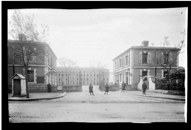
Caserne de Carcassonne