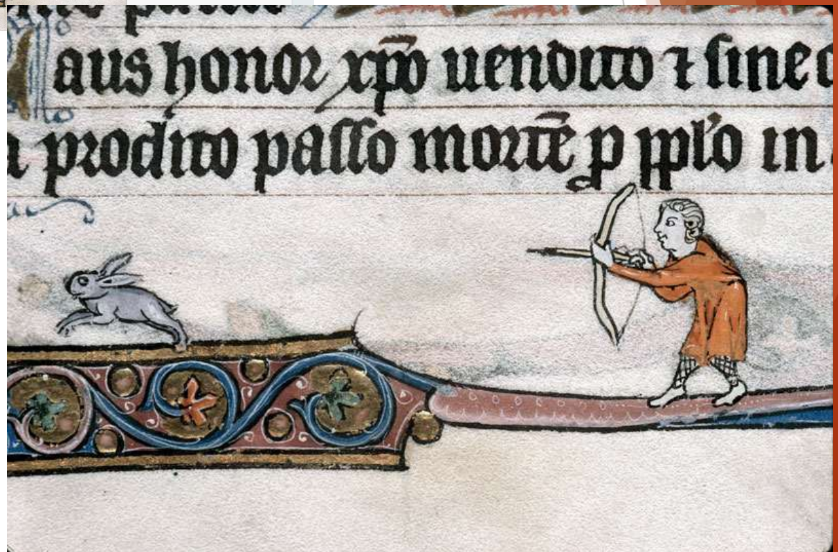
Heures à l'usage de Thérouanne - Chasse au lapin