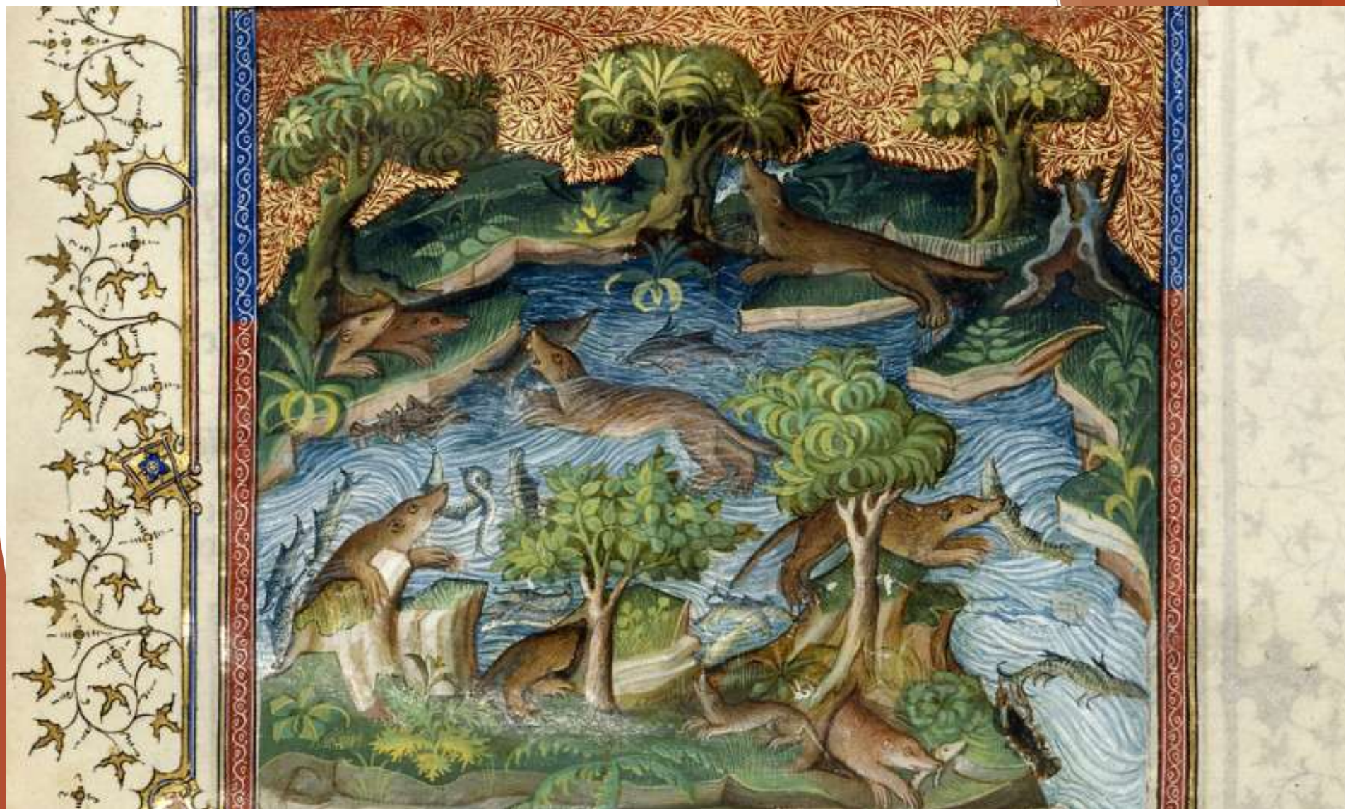
Gaston Phébus, Livre de chasse : la loutre