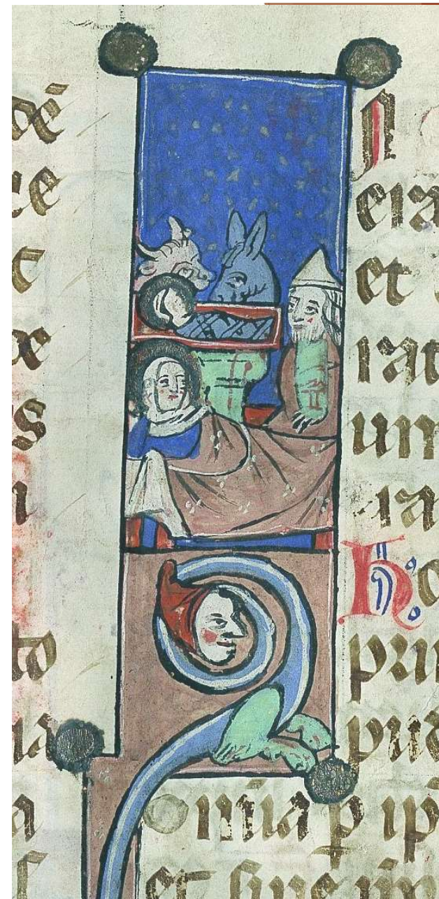
G 288 Evangeliare de Saint Nazaire-Saint Celse